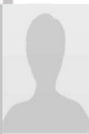
Syndia BOURGEAULT CE suppléante