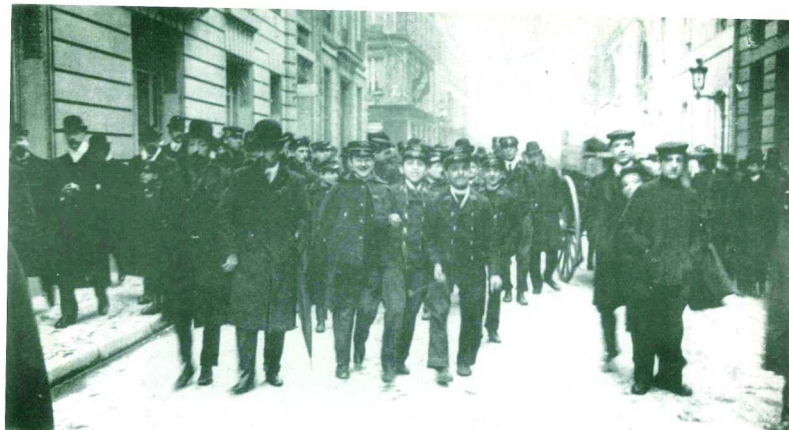
LA GREVE DES POSTIERS

Autre délire, à Amboise, pour la prochaine réorg, la DEX vient faire une réunion avec l'encadrement : un COPIL (Comité de Pilotage) se déroule dans ce monde ouaté et aseptisé qu'ils appellent « la salle blanche » : Et ils se posent un tas de questions sur leur futur carnage : ça s'appelle le « GO-NO GO » (ne pas confondre avec le petit singe, hein!) : C'est-à-dire le « on y va ou on n'y va pas? Evidemment, comme tout est déjà prévu (le nombre de PT et les îlots...) depuis longtemps pour toute l'année et tous les bureaux de la DEX, on vous laisse deviner la réponse. Ils jouent avec nos conditions de travail : Tout cela est lamentable.