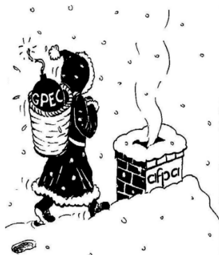
Et si l'année 2012 était l'année des résistances et des combats collectifs... ?

Débonnaire et hilare, il nous parle de la Gestion Prévisionnelle des Emplois et des Compétences (GPEC).